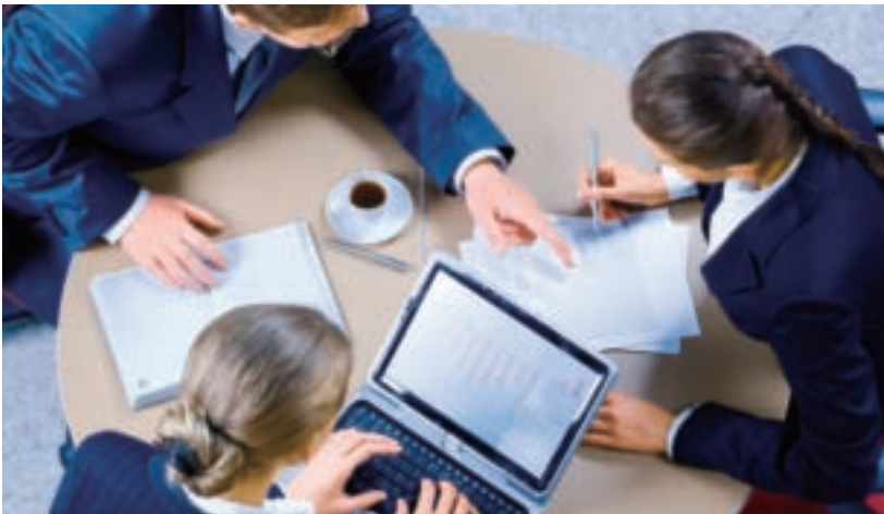
■在WTO的機制和規範下，貿易壁壘的解除固然帶來商機，但也會有新的競爭者加入，只有快速掌握市場競爭資訊，靈活調整產品組合，並進入新興市場才能勝出。

再進一步看，WTO的效應、區域經濟的整合、兩岸貿易的頻繁，都讓國內貿易業面對新的挑戰。製造業直接介入通路、與國際業者議價、國際大型客戶集中下單，也都壓縮本土中小型貿易商的空間，這類型貿易商在一定期間內或許可轉以進銷量少、異質性較高的商品，或爭取地區性代理權來突圍，不過，就長期而言，除非自我能力提升，否則即使是差異化商品的生存空間，也會逐漸縮小。貿易商大型化、具備售後服務、倉儲和物流能力，都是未來貿易商必須具備的基本條件。