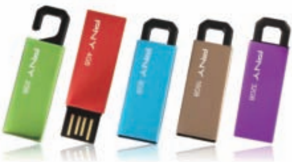
■首次參與排名即躍居最佳貿易商第2名的美商必恩威科技，其環保隨身碟深受市場歡迎，在300大貿易商中脫穎而出。

整體而言，10大最佳貿易商中有7席為本土貿易商，外資企業則由2008年的5席下滑到3席，本土貿易商終於扳回一城，拿回最佳貿易商的主導權。不過在7家本土最佳貿易商中，其實有4家營收呈現衰退的處境，這