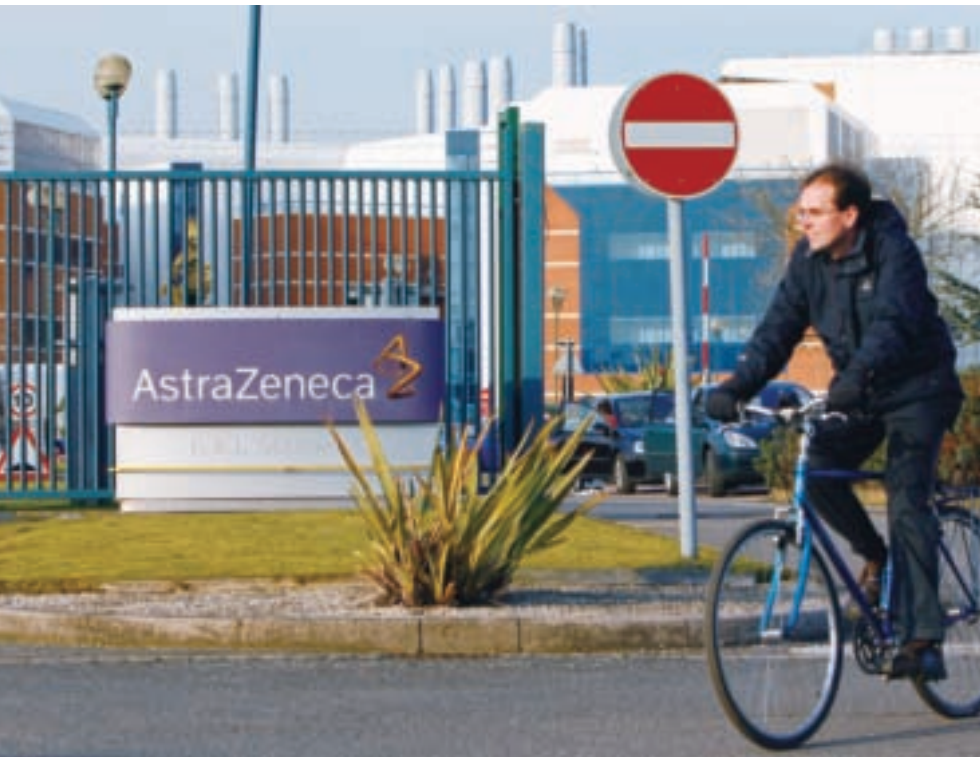
■臺灣阿斯特捷利康為全球百大企業阿斯特捷利康（AstraZeneca）藥廠在台子公司，去年營收突破40億元，在台營運前景持續看好。

其次，前20大貿易商中，外資貿易商就占有11家，入榜席次仍然過半，其中日商占有6席，除了顯示日商貿易商長期在台耕耘的優勢，也顯示本土貿易商多半規模較小的劣勢（營收達100億元者僅有特力），努力空間還很大，如何協助貿易商壯大，也是政府的重要課題。■