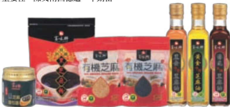
富味鄉是全台第一家通過有機芝麻製程驗證的芝麻廠商。