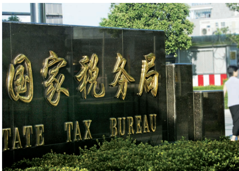
中國大陸稅務局放寬個體工商戶條件，讓業主在繳納個人所得稅時，能扣除已支付工資等優惠，大幅減輕成本壓力。

而且，個體戶的業主在繳納個人所得稅時，也可先扣除固定費用及支付的工資。根據中國大陸自2011年9月1日起實施的新規定，個體工商戶業主繳納個人所得稅時，可以在稅前扣除每年42,000元人民幣、每月3,500元人民幣的費用，以及已經支付的工資，因此，就能大幅減少業主所