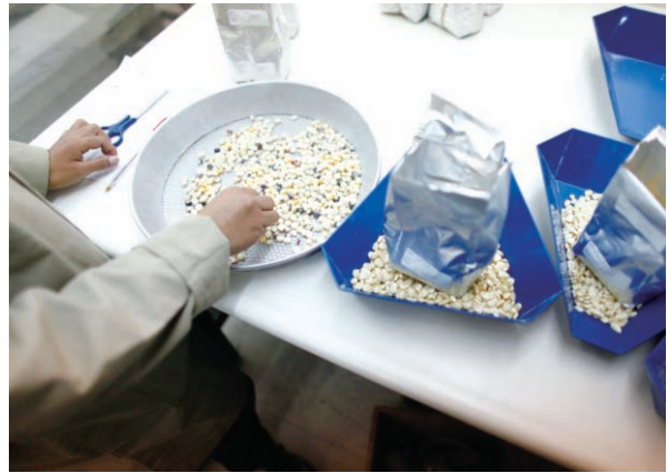
為解決氣候變遷對農業造成的影響，改良農作物的品種亦有助於適應惡劣環境。

Company Inc (BCC) 研究顯示，2005到2010年間，全球合成農藥（化學農藥）市場，每年平均以1.5%負成長的速度縮小，相反的全球生物性農藥市場則以年平均成長率9.9%的速度擴大到10.75億美元。