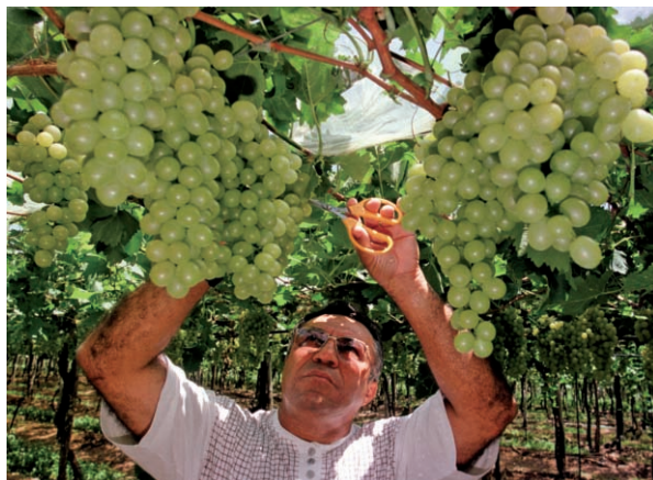
氣候變遷影響農作物生產區域並改變生產季節，原集中在法國南部的葡萄酒產區，因氣候變遷已漸往北移動。

此外，溫室效應讓地球的高溫、乾旱變成常態，使得原本應該穀物豐收的季節，開始出現歉收的現象，諸如印尼、中國東北、美國中西部等地的旱災，都出現穀物產量減少的情形。