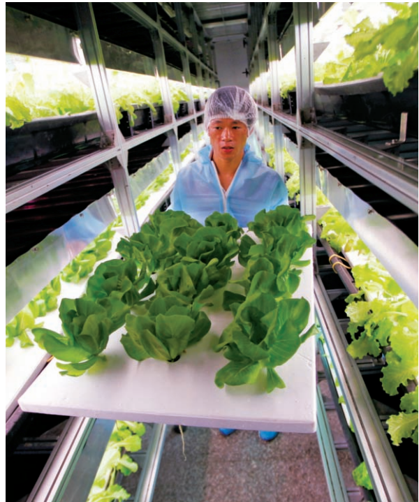
不受天候、日照時間限制的LED植物照明，可調節農產品生產時間，解決在特定時節面臨糧食短缺地區的問題。

將使原本已顯吃緊的糧食供需狀況變得更嚴峻。先進國家欲以科技改變潛在糧食危機壓力已有多年，也因此LED技術成熟，讓植物照明的未來商機備受青睞。