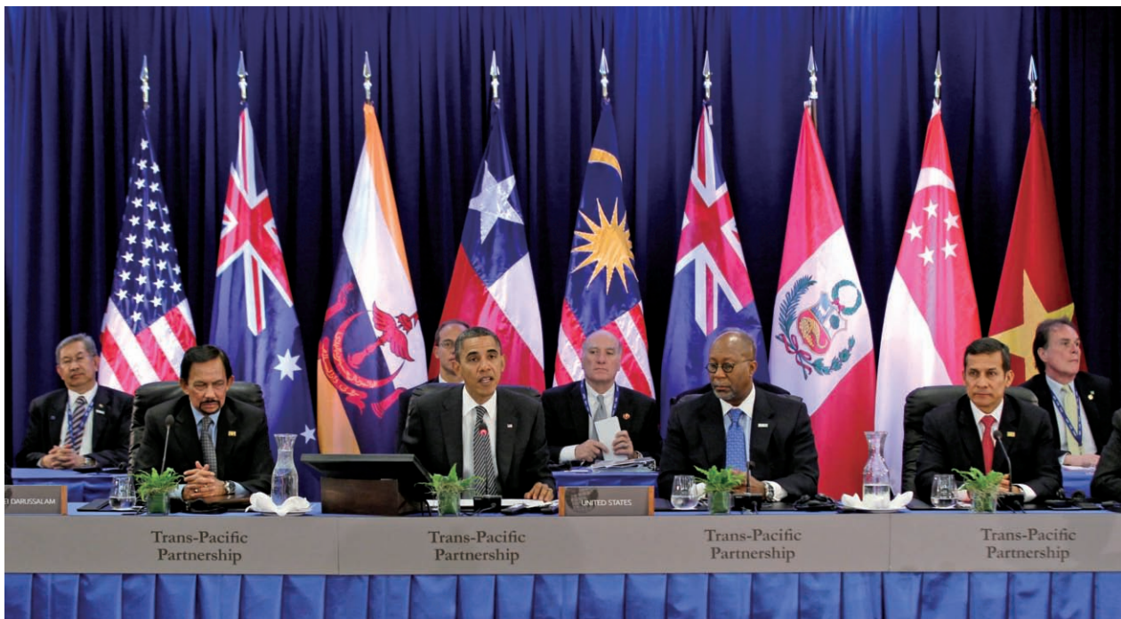
「跨太平洋戰略經濟夥伴關係協定」(TPP)由美國總統歐巴馬主導，目前已有多國參與，以促進亞太地區自由貿易為主要訴求。

35%，高於歐盟，為全球經濟規模最大的區域經濟組織。另外，TPP十國的合計出口量占台灣出口的30%，所以，未來關稅減讓的出口效果將非常可觀。另一方面，TPP十國在台灣進口市場占有率更高達42%，所以台灣必須有大幅開放市場的準備。」