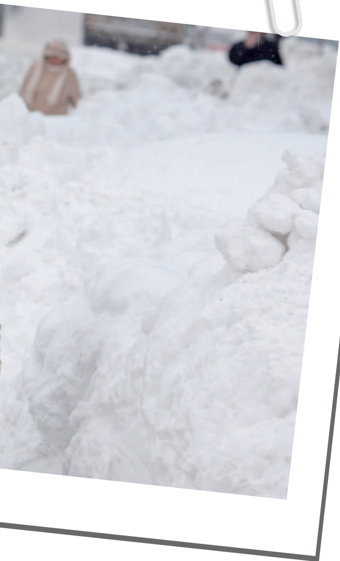
溫室效應造成氣候異常，嚴重影響全球經濟與產業活動。

的經濟活動，都得看天氣的臉色。」若依2010年世界生產總值的63.17兆美元來計算，2010年全球總值大約有50.54兆美元的經濟活動與天氣有關。