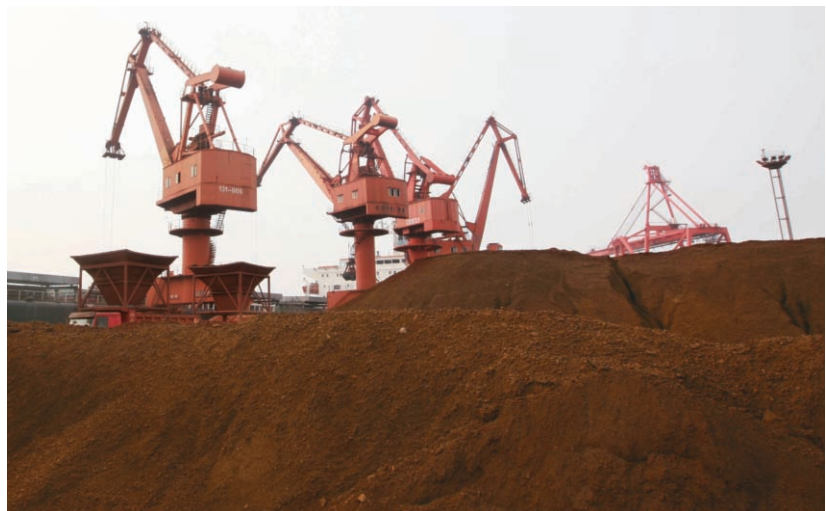
由於全球經濟景氣趨緩，加上主要消費大國日本及美國減少需求，造成稀土價格暴跌，中國大陸的稀土企業紛紛以停產或減產來因應。

影響所及，中國大陸稀土產業首當其衝。據中國大陸媒體公布的消息，2012年前9個月中