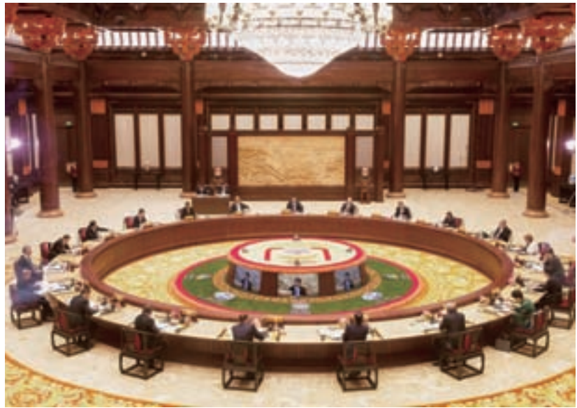
2014年的APEC在北京市雁樓湖展開，共有22個國家的元首或財經首長與會。

出「邁向創新驅動發展倡議」（Toward Innovation-Driven Development），承諾在科學、科技與創新方面，建立務實、有效率且積極的夥伴關係，另外也承諾強化對中小企業的支持，並提供有利中小企業推動創新活動的環境，如會員體共同努力推動的「APEC加速器網絡倡議」（APEC Accelerator Network）。