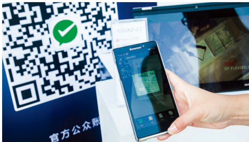
利用二維條碼QR code，提供消費者優惠資訊與景點說明已成為趨勢。

北部地區之外，高雄主要商圈之一的統一夢時代購物中心，近兩年來也積極建構智慧購物服務。早在2013年，統一夢時代購物中心導入二維條碼，讓民眾只需使用手機掃描購買商品的條