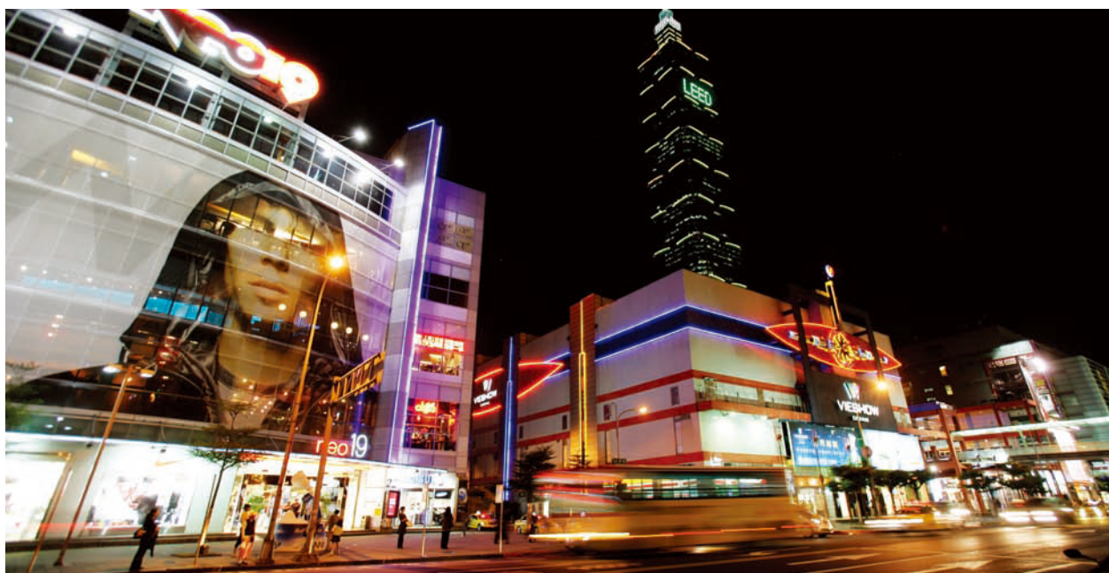
台灣從北到南陸續有傳統商圈朝向智慧商圈邁進，台北信義商區已經導入各項資訊科技，創新商業服務。

來10年，在智慧聯網以及認知運算（Cognizant Computing）的急速發展下，人手一支的智慧型手機，可以在消費者到購物中心逛街購物時，結合當地店家資訊，提供消費者適性適地的購物優惠，同時幫助消費者進行購物計