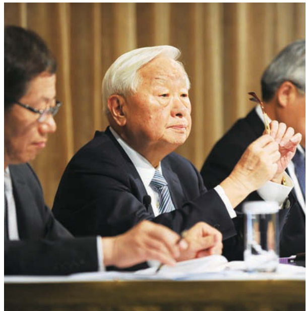
面對這波出口困境，台積電董事長張忠謀預估，要到2015年底才能逐漸恢復。

觀察2015年下半年發展趨勢，中華經濟研究院指出，未來國際發展仍然充滿諸多不確定因素，包括美國升息時程、國際油價走勢起伏、中國大陸經濟走緩與兩岸產業競合關係不明，都將對未來台灣經濟發展帶來影響。面對台灣出口持續衰退，工總理事長許勝