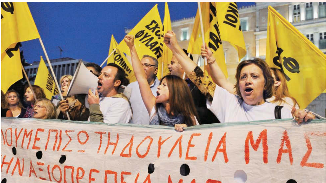
希臘歐債等全球金融事件暫獲解決後，將有助於台灣整體經濟態勢回穩。

關稅涵蓋比重過低，產業出口面臨較高關稅門檻，更是台灣出口產業面臨的最大障礙之一。