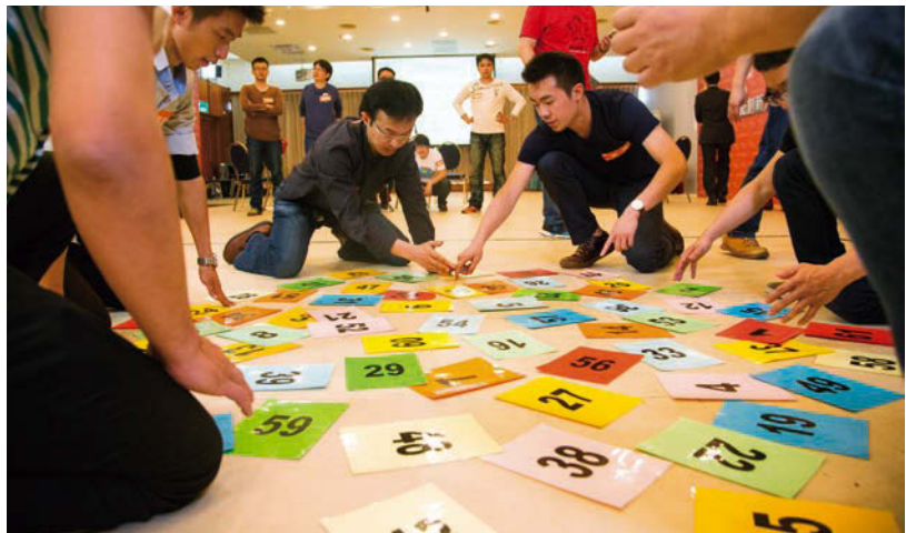
民間企業推動與創業家精神，才是真正展現台灣旺盛創業能量的關鍵。

已陸續完成「電子支付機構管理條例」、「公司法」、「股權式群眾募資」以及「創業家簽證」等16項相關新創法規立法及調適措施，友善國內創業環境。