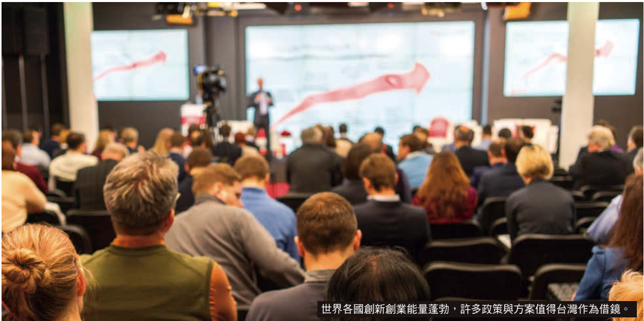
世界各國創新創業能量蓬勃，許多政策與方案值得台灣作為借鏡。