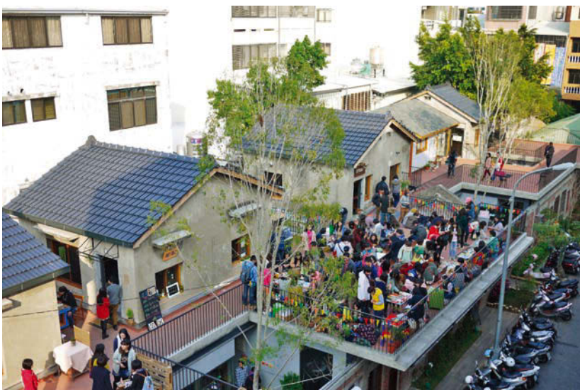
范特喜集團受到各縣市政府的邀請，進行全台灣的老空間活化工程。

另一方面，眾社會企業也為身障者打造出創新職種「友善特派員」，即聘僱身障者蒐集、調查與評估店家的無障礙設施資訊，建置智慧城市友善資訊，成