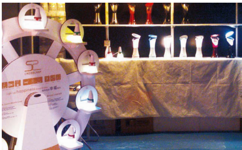
飛想應用科技所研發的燈具，加入創意把家具變成生活樂趣。