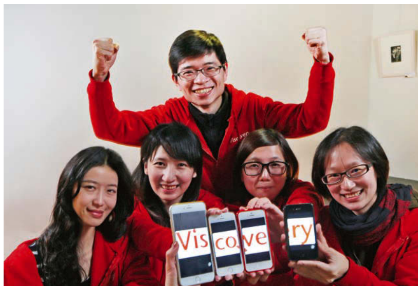
創意引晴的成功，在於研發出領先亞洲市場的頂尖影像辨識技術，因而受到市場青睞。

儘管技術已獲得領先，但是資訊科技的推陳出新，讓創意引晴積極開拓市場之際，仍然緊鑼密鼓地迎合科技潮流發展新技