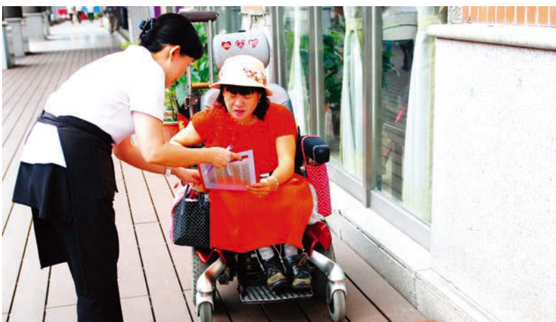
众社會推出的友善台北App，為身障人士、孕婦、老人等行動不便者與其家屬解決生活不便的問題。

功將以往的被服務者轉變為公司團隊的核心角色；此外，众社會企業也為政府機關與各類服務業者，提供有關無障礙友善設施改善、人員訓練提升、諮詢輔導認證的服務，從各種服務模式落實發展更友善的社會。众社會企業創辦至今，已先後訓練並雇用178位專兼任身障者，友善餐廳APP服務遍及台灣與香港8個城市，今年秋天更接受馬來西亞與菲律賓政府和企業委託，帶領台灣「友善特派員」前往訓練當地身障者建置服務。