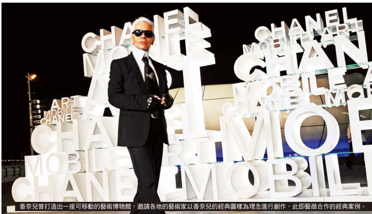
香奈兒曾打造出一座可移動的藝術博物館，邀請各地的藝術家以香奈兒的經典圖樣為理念進行創作，此即藝商合作的經典案例。