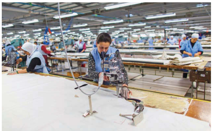
告別生產製造興盛的年代，以及東南亞國家低廉勞力優勢的崛起，台灣必須積極在社會資本與文化資本上努力，為產業創造更多競爭力。