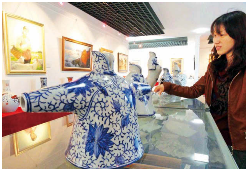
擁有千年歷史的陶瓷產業面臨轉型升級關鍵，台灣業者可思考在既有優勢上融入新元素，必能創造出全新的驚人價值。

進一步從創新產品的層次來看企業與藝術的融合。由於世界已進入生產過剩時代，如何透過文化藝術，提升商品層次，進