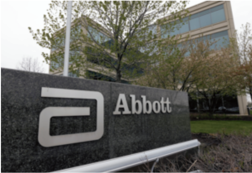
美商亞培公司排名連續3年上升，主要原因是掌握台灣老年人口日益增加，瞄準銀髮族市場的策略奏效。

130.38億元，則較2014年微幅成長0.37%，占集團營收比重也由2014年的36.1%，微幅上升到36.3%。