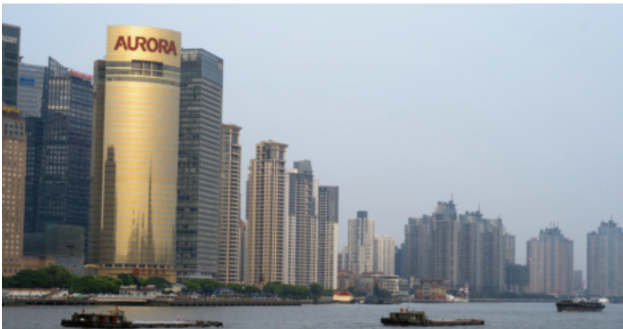
震旦行榮登貿易商獲利王，專注於兩岸辦公市場產品，提供客戶優質整合辦公室解決方案，去年獲利成長12.57%，顯見獲利成長動能強勁。

2.74%，但稅前純益前10大貿易商合計稅前純益高達70.85億元，反而較2014年的66.62億元成長6.35%，但占300大貿易商總體比重上升到40.14%，創下新高。其中，震旦行、廣越企業、車美仕及德麥食品4家貿易商稅前純益創下新高。