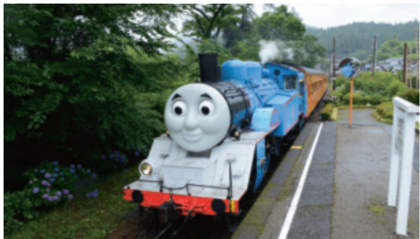
伯寶行從事玩具代理及進口銷售業務，包括湯瑪士火車、Hello Kitty等代理品牌，透過實體及網路行銷通路的整合，去年創下5.75億元營收新高，首度入榜300大貿易商。

排名營收成長率第4名的伯寶行，雖於2012年起參與排名，但在2014年以前其營收都