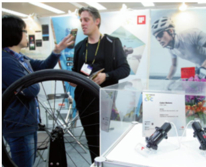
自行車零件與運動器材的製造與出口，是台灣產業的強項之一，不少貿易商在此領域用心琢磨，順利將品牌產品賣向全球市場。

2014年營收與獲利雙成長的貿易商家數為74家，2015年則大幅減少至46家；其次，在46家營收與獲利雙成長的貿易商中，僅有9家為營收與獲利同時成長達20%以上，不僅遠低於2014年的18家，且其中更只有