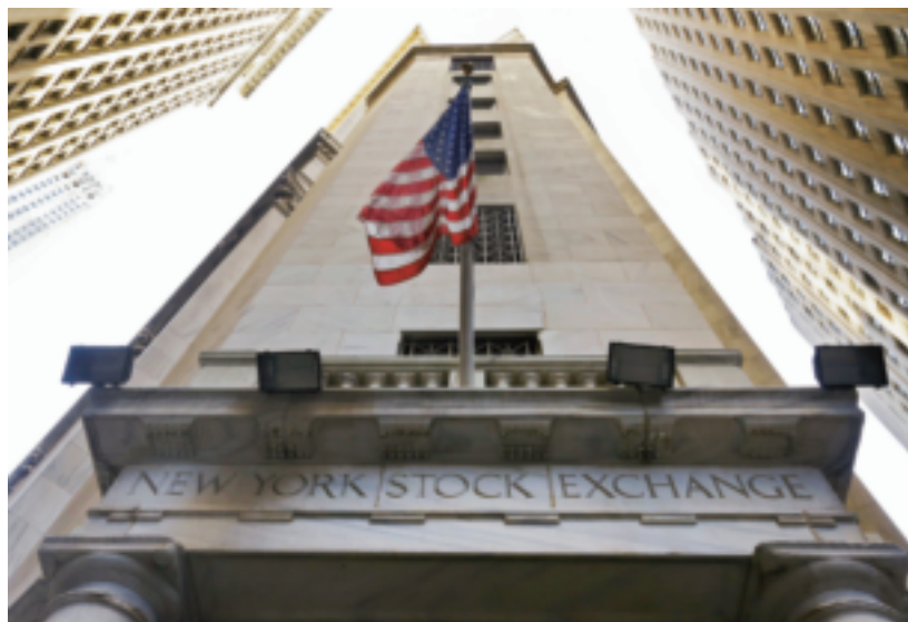
2015年全球景氣仍舊低迷，除了美國經濟一枝獨秀，包括中國大陸、日本及台灣等國家的進出口持續衰退。