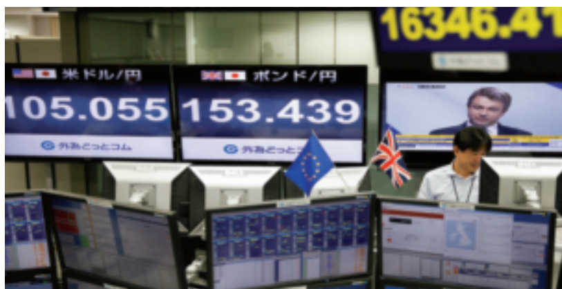
面對全球貿易成長趨緩，加上貨幣寬鬆造成世界各國的匯率波動變大，貿易商必須掌握避險能力，避免利潤被匯損所侵蝕。

由於300大貿易商用人相對穩定，因此每一員工銷貨額的排名波動不大。以2015年300大貿易業每一員工銷貨額前10大貿易商（詳見表七）來說，仍有6家蟬聯入榜的貿易商。新入榜的貿易商分別是第2名的利臺國際、第8名的國際艾歐資訊及第10名的詠璽海產國際。此一排名通常有其延續性，主因為員工產值高的貿易商通常不會突然降低，因而排名變化相對其他指標排名來得小。另外，2015年每一員工銷貨額前10大貿易商的門檻由1.55億元小幅上升至1.59億元，反映到生產力指標（每一員工純益額），但去年生產力指