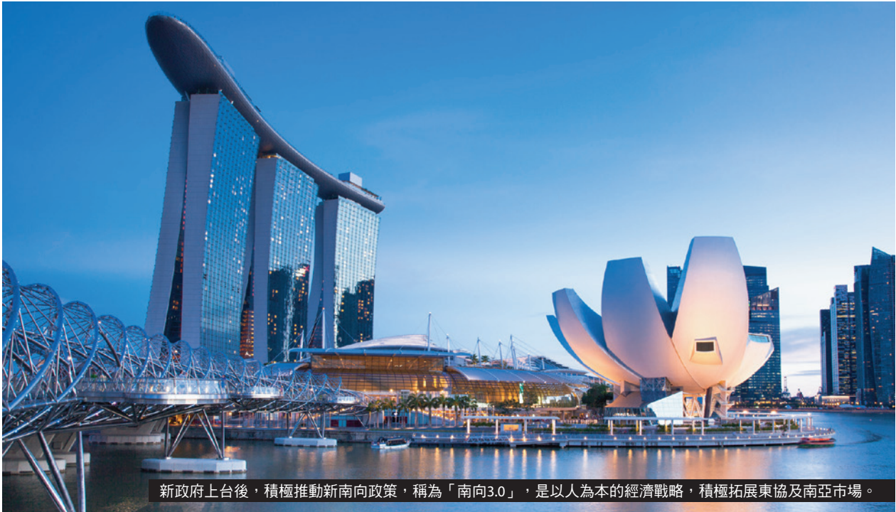
新政府上台後，積極推動新南向政策，稱為「南向3.0」，是以人為本的經濟戰略，積極拓展東協及南亞市場。