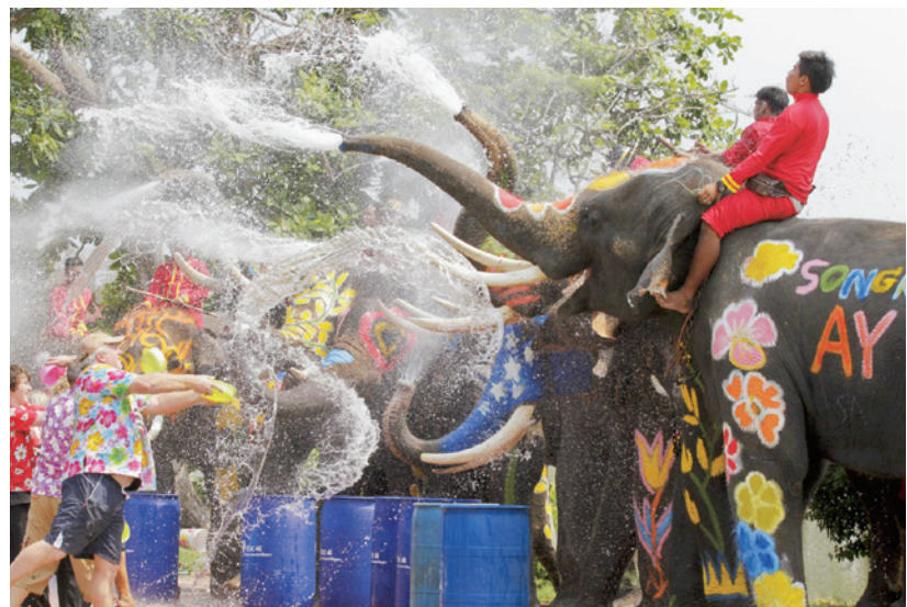
台灣來自東南亞的新住民愈來愈多，政府必須更貼近東南亞各國文化，例如泰國潑水節等特殊節慶，透過文化融合才能掌握當地市場需求，以利台商開拓商機。