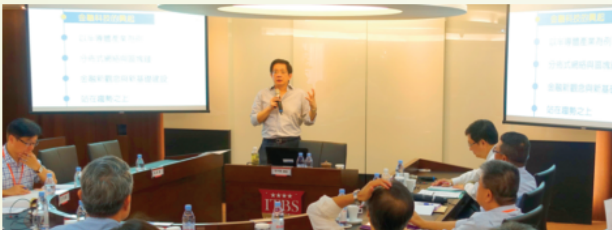
台灣大學財務金融系特聘教授管中閔指出，金融科技不只帶來破壞式的創新，也改變了消費者的消費行為。

避免賣不出去，這又牽涉到商業模式的建立，這些階段都屬於企業的修身、齊家與治國概念，當年台積電以創新晶圓製造的商業模式，成功開拓全球半導體代工製造市場，就是成功的典範。之後企業進一步朝向國際化布局，將「併購」列為重要策略，這種類似平天下的概念，才能讓企業在國際化發展過程中，走得更順遂，像是鴻海集團不停採取併購策略進行全球布局即為一例。