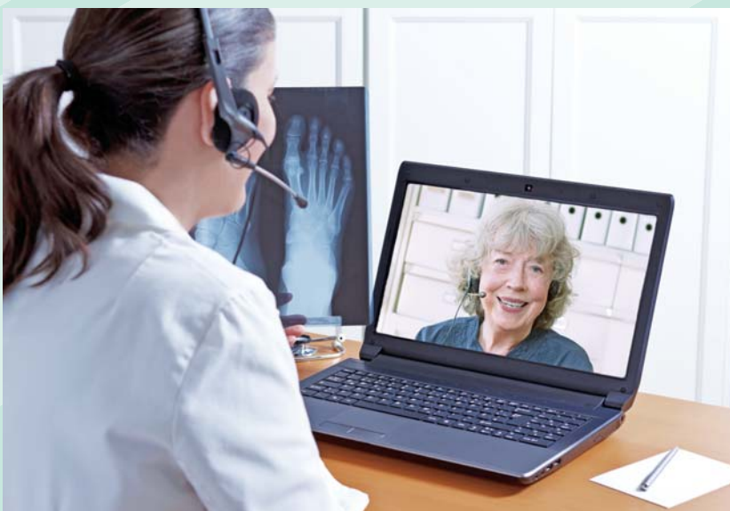
透過遠距醫護等整合健康服務，滿足老年人在生活、健康與醫護上的需求。

族健康諮詢與生活支援的服務提供者；又或者，緣自民眾對健康與預防保健觀念的重視，萬國健康公司結合必翔、蓋德等科技公司，創新研發行動健康管理模式，如睡眠照護、健康營養與慢性病管理等，讓長者可以安心在地養老；還有104資訊科技公司發展中高齡生活支援管理系統服務模式，成功銜接社區資源與自費市場，打開銀髮健康照護商機；多扶事業公司則主推台灣銀髮旅遊，並促成日本長宿銀髮族來台體驗，讓銀髮族走向戶外。