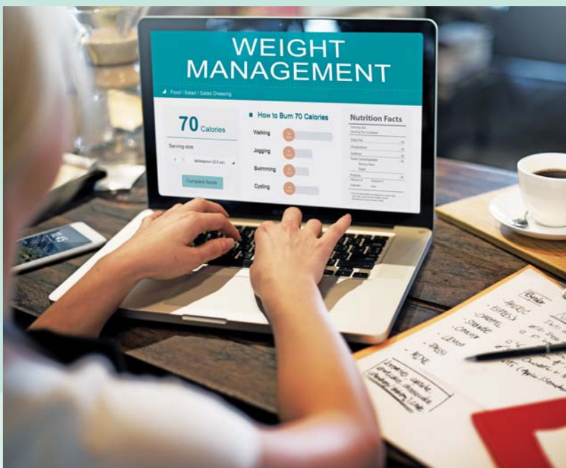
台灣在雄厚的ICT科技基礎之上，若能結合經驗豐富的照護體系，以嶄新的思維，整合多元類型的產業，將有助於發展具競爭優勢的健康服務產業。