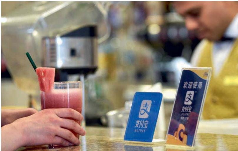
隨著網購發達，無論是阿里巴巴、京東、亞馬遜都朝結合大數據、網路支付工具，以FinTech技術發展「新零售」模式，這也是未來貿易商生存的關鍵。

2016年首次出現每一員工銷貨額前10大貿易商和生產力指標前10大貿易商出現脫鉤的情況，值得明年持續留意此一反向趨勢的發展。