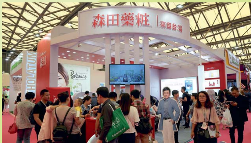
原代理日本藥妝品的貿易商森田生醫，看準生物科技新趨，自行投入創新研發，在成功站穩國內市場的同時，進軍國際市場。

不管是以生物科技創新食品或化妝保養品，還是欲為農產品本身提高附加價值，其農產品本身具備最好品質成為必要條件。因此在農業種植過程中，強調無毒、無害，成為贏得市場的關