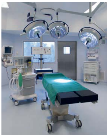
主要業務為進口手術醫療設備的惠興，2016年的稅前純益率有極佳表現。

由這10大貿易商的表現，可看出這些貿易商已走出傳統貿易範疇。連小至女性髮飾產品，弘帆都可透過研發和經營的創新賺取高獲利，並且由髮飾供應商轉型為全方位飾品配件供應商。去年，弘帆更併購兩家全球知名的髮飾配件與手工藝供應商芳協與昱匯，取得新客戶及新市場。由弘帆的「變革」，可給予習於「以不變應萬變」的傳統貿易商全新啟發！■