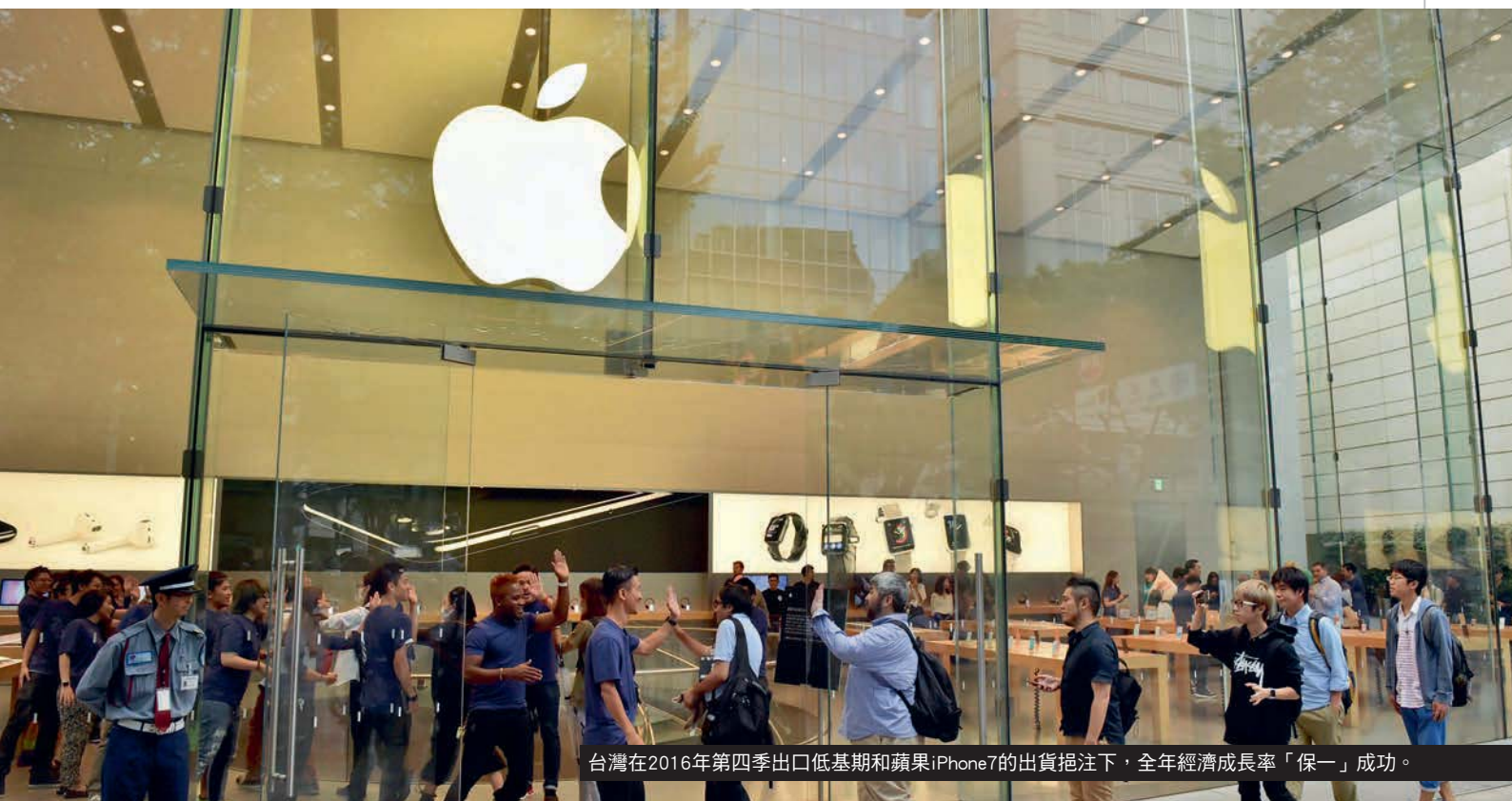
台灣在2016年第四季出口低基期和蘋果iPhone7的出貨挹注下，全年經濟成長率「保一」成功。