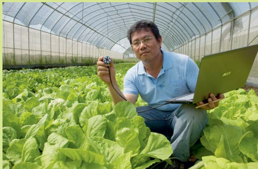
巨農有機農場等台灣重要農企業，透過智慧化生產管理，一改過去耗時的工作流程，便捷記錄田間動態。