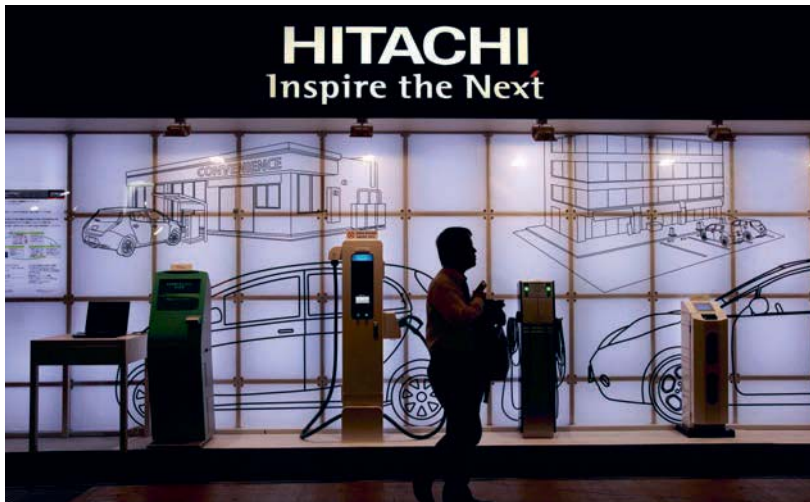
台灣日立亞太不僅名列營收淨額前20大貿易商，近年因具節能、環保意識產品在市場上大行其道，造就其2016年高達23.49%的營收成長。