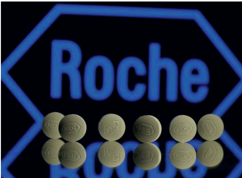
首度擠進營收淨額前20大貿易商的羅氏大藥廠，專注於西藥銷售，連續3年成長，未來在台發展可期。

今年300大貿易業新入榜的貿易商表現亮眼，值得關注的是首度擠進前20大貿易排名，由西藥業轉至貿易業的羅氏大藥廠，業績表現可期；恆隆行貿易朝創新經營及多元化發展，也讓業績持續大爆發。