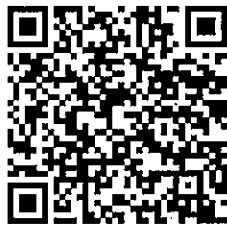
網路報名 QR code