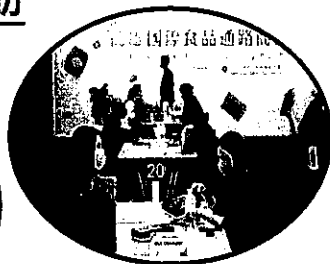
一對一採購洽談會