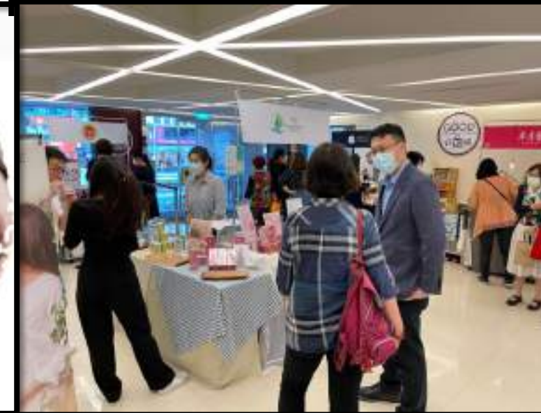
線下實體推廣展&好物推廣市集