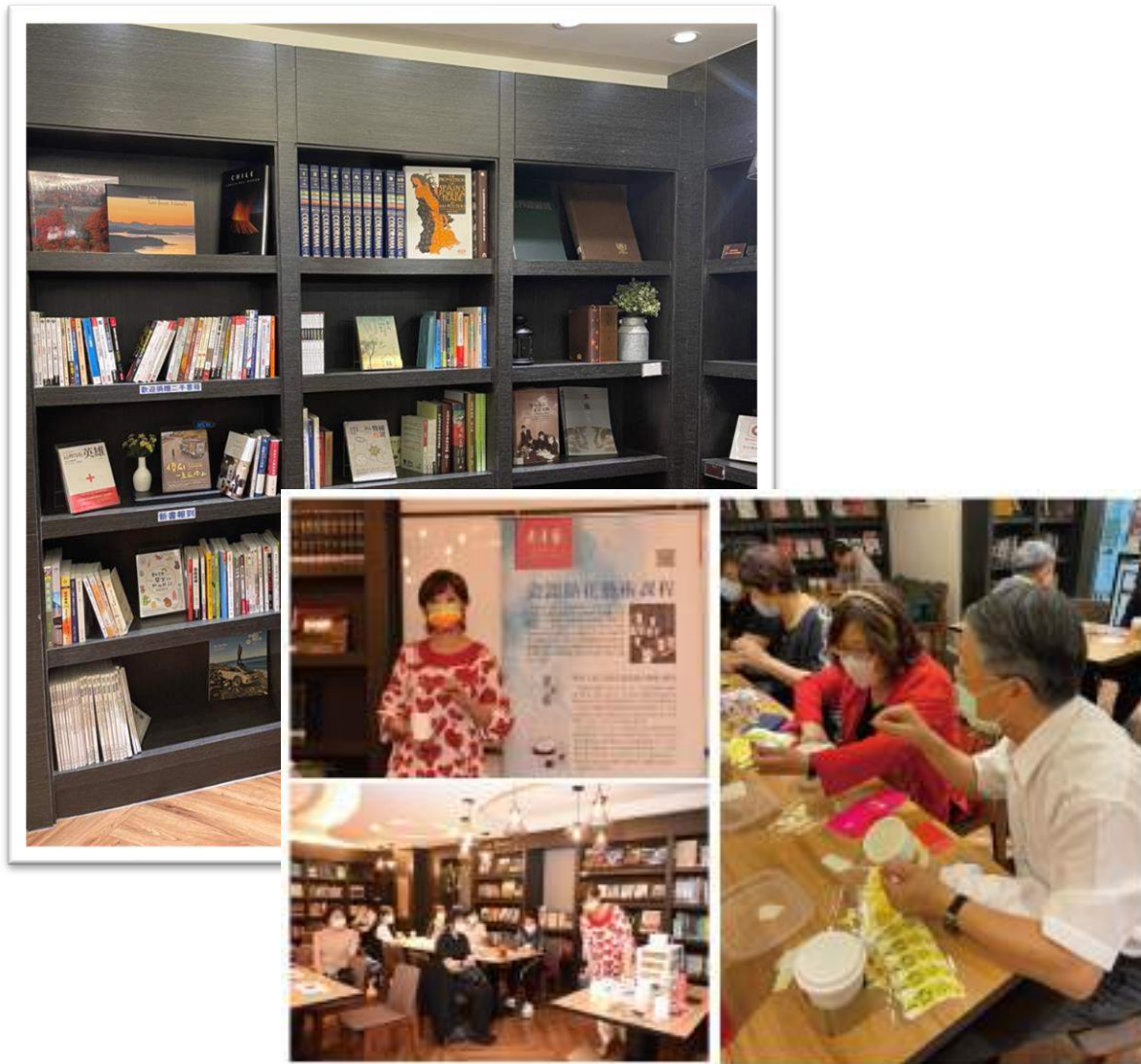
上圖為木犀瓷藝術貼花體驗活動課程