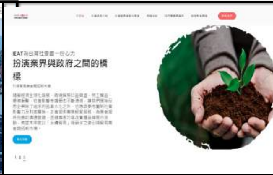
主題性品牌推廣活動專網(如:2021年ESG永續貿易網)