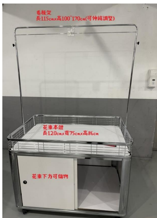
花車本體(長*寬*高：120cmX 75cm X 86cm)