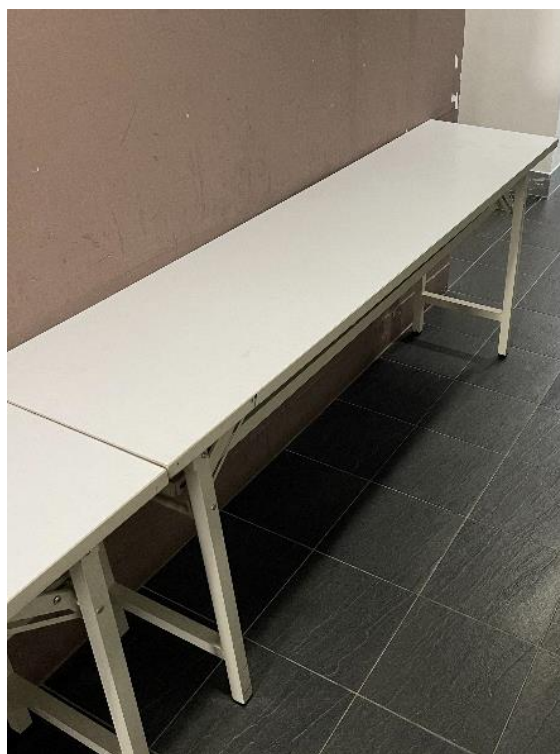
長形桌尺寸長*寬*高 180cm X 45cm X 75cm