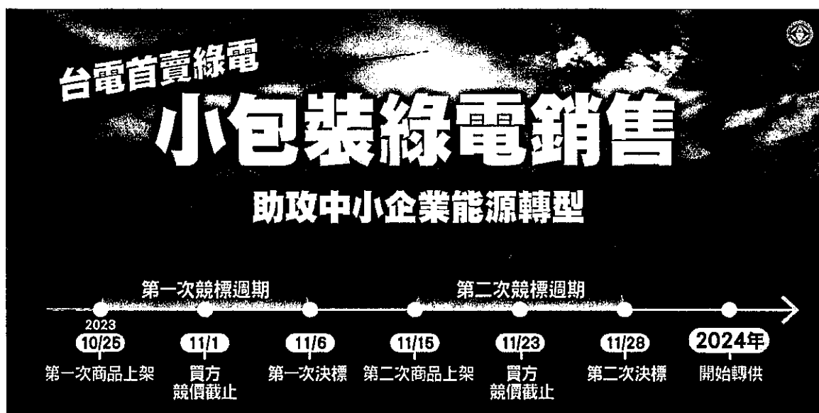
台電公司小額綠電標售期程

國際淨零碳排趨勢日漸抬頭，國內企業對綠電及憑證之採購需求快速攀升，經濟部標準檢驗局(下稱標準局)為協助綠電暨憑證供需雙方交易，提出多元解決方案，訂定「國營事業案場再生能源電力及憑證媒合服務作業程序」，並於國家再生能源憑證中心(下稱憑證中心)官網打造嶄新「綠電競標區」，與台灣電力股份有限公司(下稱台電公司)合作，台電公司推出之「小額綠電銷售試辦計畫」使用。台電公司規劃年底前於標準局憑證中心綠電媒合平台上架 5,000 萬度自建綠電供企業競標，歡迎各企業參與競標購買綠電。