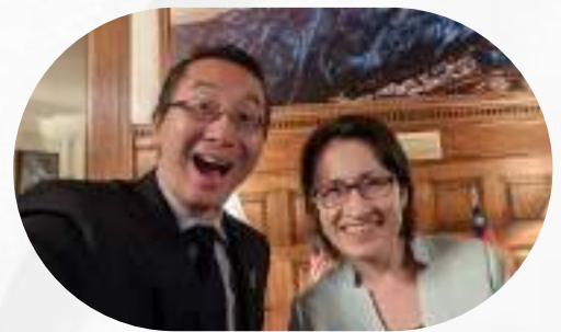
拜見 現任副總統 蕭美琴(時任駐美大使) 討論凝聚在美台商與台籍留學生職涯培育