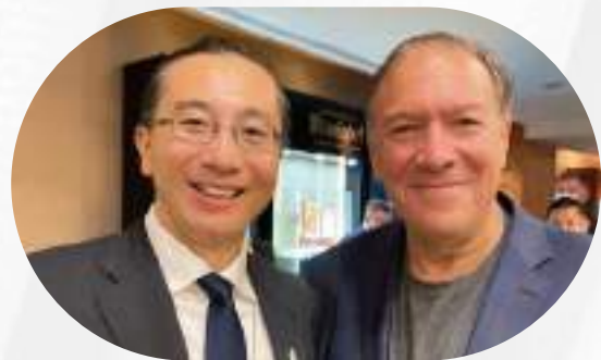
負責陪同美國龐培歐前國務卿訪台與探討更加協助台商赴美發展方案