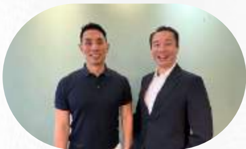
高端客製化旅遊企業負責人 利用創業簽證赴美發展