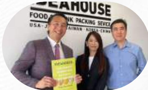
幫助台日食品容器企業 赴美拓展版圖