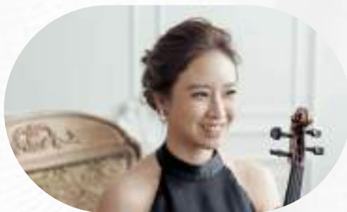
才華橫溢音樂家成功設立 音樂教室辦理創業簽證