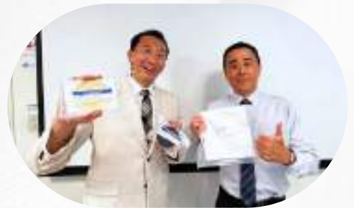
半導體清潔耗材廠商 辦理多位銷售與技術員工簽證