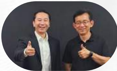
世界知名 85°C 辦理 多種不同類型工作簽證與綠卡