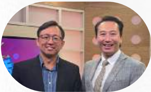
幫助台積電自動化協力廠商 引進多位技術人員