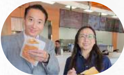
來自台中的 繼光香香雞 赴美發展 辦理高管與技術人員簽證