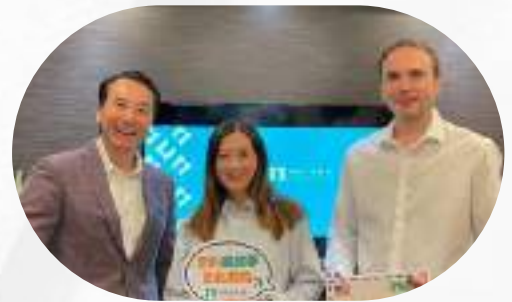
居留巴黎多年後的台法家庭 收購加州企業成功辦理投資簽證