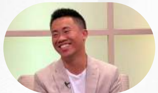
大學同學們發明全新滑板設計 經由創業辦理工簽與移民