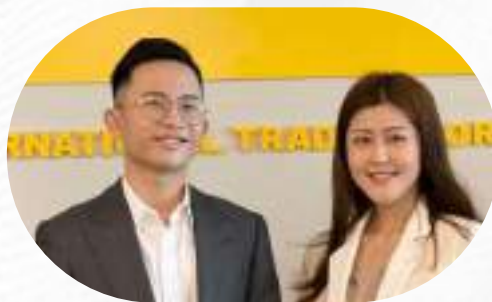
年輕創業家夫妻搭檔 利用創業簽證打入美國家具產業