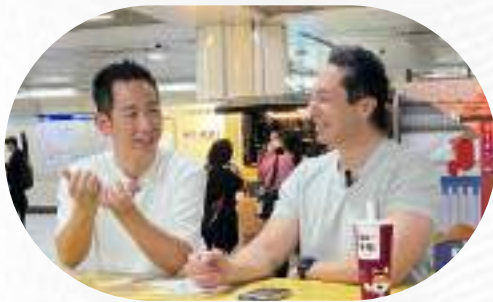
結合科技與移民方案幫助 機器人餐飲業 Yo-Kai Express 拓展