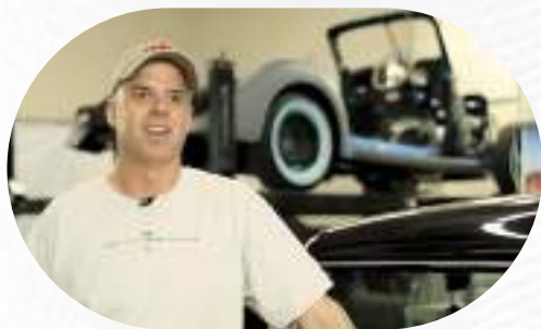
加拿大國籍古董車改裝高手 辦理創業簽證與傑出人才綠卡