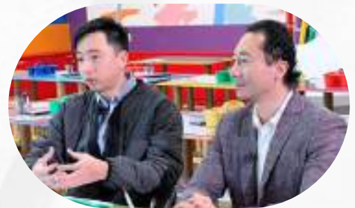
協助台灣知名蠟藝蠟筆企業 外派高管赴美拓展版圖