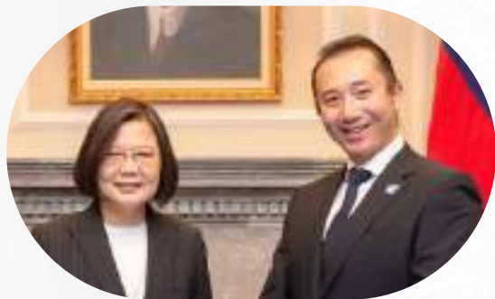
拜見蔡英文前總統 提議政府多幫助在美留學生畢業後留美攝取經驗方案