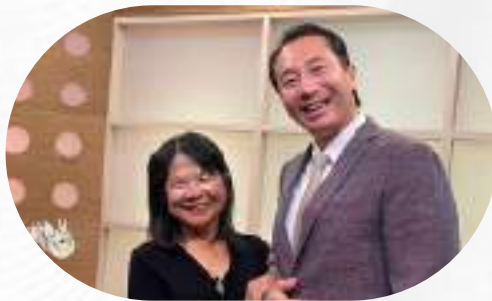
協助遭遇多次 AIT 拒簽的 台積電協力廠商成功辦理多數簽證