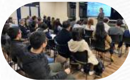
每年辦理多次台灣與美國大學【跑校園】簽證與移民講座活動提供學生長期留美發展的法律資訊