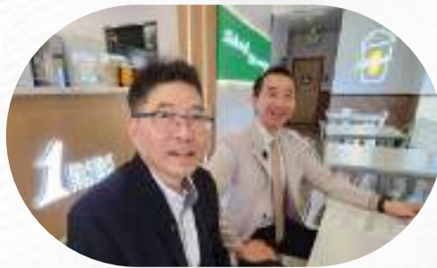
50嵐 關係品牌 一點點 外派員工赴美發展