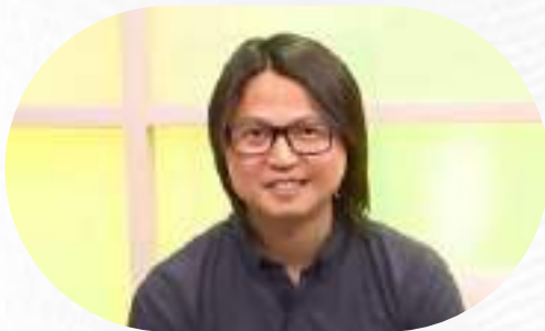
協助攝影業發明家 快速辦理傑出人才綠卡