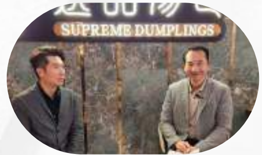
美國知名 輝月集團 經由 投資簽證與移民方案拓展版圖